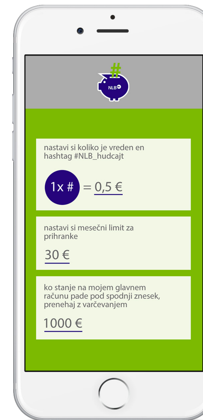
Aplikacija NLB Hudcajt omogoča uporabnikom varčevati s popolnim nadzorom.

Funkcija hashtag-a #NLB_hudcajt je poleg tega tudi širjenje zavedanja o pomembnosti varčevanja med mladimi , saj se ta kar na enkrat razširi po profilih Instagram uporabnikov.